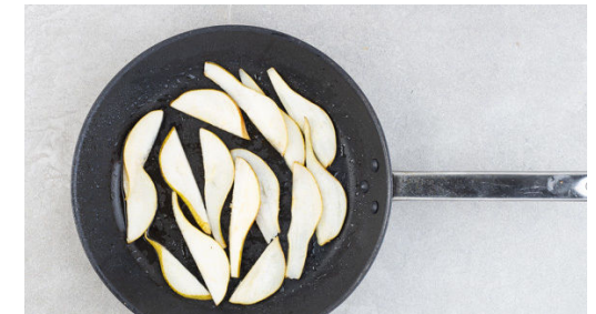
6. Birnen braten

Das Fleisch trocken tupfen und waagrecht halbieren, sodass 2 Schnitzel entstehen. Diese ggf. etwas dünner klopfen und mit Salz und Pfeffer würzen, dann in einer mittelgroßen Pfanne mit 1EL Olivenöl bei starker Hitze auf jeder Seite 1-2Min. scharf anbraten, bis das Fleisch durch ist. Auf einem Teller abgedeckt beiseitestellen.