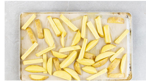
2. Kartoffeln rösten

Den Backofen auf 230°C (210°C Umluft) vorheizen. Die Birne vierteln, den Strunk und das Kerngehäuse entfernen, dann der Länge nach in ca. 0,5cm dünne Scheiben schneiden. Die Tomate vierteln, entkernen und in sehr kleine Würfel schneiden.