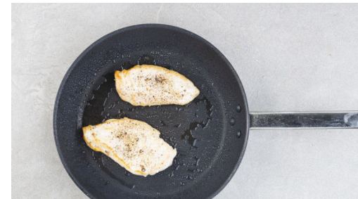
5. Fleisch braten

Den Salat in ca. 1cm dünne Streifen schneiden, den Strunk entfernen. Für das Dressing jeweils 2EL Olivenöl, Essig und Wasser oder Fruchtsaft verrühren und das Dressing mit Salz und Pfeffer sowie 1 Prise Zucker abschmecken. Die Brötchen leicht befeuchten, dann aufschneiden und ca. 4Min. im Ofen aufbacken.