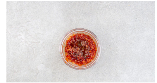
3. Dip anrühren

Die Kartoffeln samt Schale in ca. 1,5cm dicke Stifte schneiden. Auf einem mit Backpapier ausgelegten Backblech mit 1EL Olivenöl sowie 1 Prise Salz vermengen und im Ofen 15-20Min. rösten, bis die Kartoffeln knusprig und gar sind.