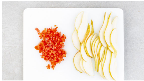
1. Birne schneiden

Energie 963kcal, Fett 34.1g, Kohlenhydrate 113.2g, Eiweiß 45.5g