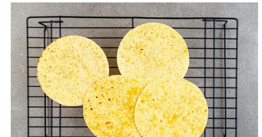
6. Tortillas erwärmen

Das Brühgewürz und die Chiliflocken mit 250ml heißem Wasser verrühren und beiseitestellen. Das Tomatenmark und das Hackfleisch zu den Zwiebeln in die Pfanne geben und bei starker Hitze 3-4Min. mitbraten, bis das Hackfleisch leicht gebräunt ist.