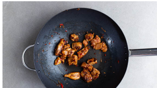
4. Fleisch braten

In einem großen Topf ausreichend gesalzenes Wasser für die Nudeln zum Kochen bringen. Den Knoblauch schälen und fein reiben oder würfeln. Das Fleisch trocken tupfen und mit dem Knoblauch und 2-3EL Chili-Zitronengras-Sauce vermengen.