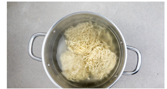
3. Nudeln kochen

Die Zwiebeln , die Pak-Choi-Streifen und die Karotten in der Pfanne oder dem Wok mit 1EL Pflanzenöl bei mittlerer Hitze ca. 5Min. anbraten, bis das Gemüse weich wird. Das Fleisch , die übrige Chili-Zitronengras-Sauce und etwas des aufbewahrten Kochwassers unterrühren, mit je 1 Prise Salz, Pfeffer und Zucker würzen und alles noch 1-2Min. weiterbraten.