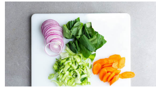
2. Zutaten vorbereiten

Das Fleisch in einer großen Pfanne oder einem Wok mit 1EL Pflanzenöl bei mittlerer Hitze 2-3Min. goldbraun anbraten. Auf einem Teller beiseitestellen, die Pfanne auswischen.