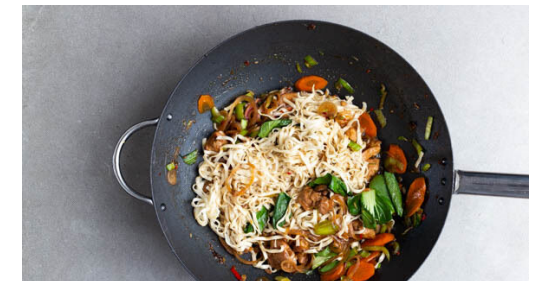
6. Nudelpfanne fertigstellen

Die Nudeln in das kochende Wasser geben und in 3-5Min. bissfest kochen. Mit einer Tasse etwas Kochwasser abschöpfen, dann die Nudeln in ein Sieb abgießen und kalt abschrecken.