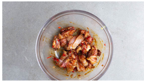
1. Fleisch würzen

Energie 1064kcal, Fett 38.9g, Kohlenhydrate 126.3g, Eiweiß 48.8g