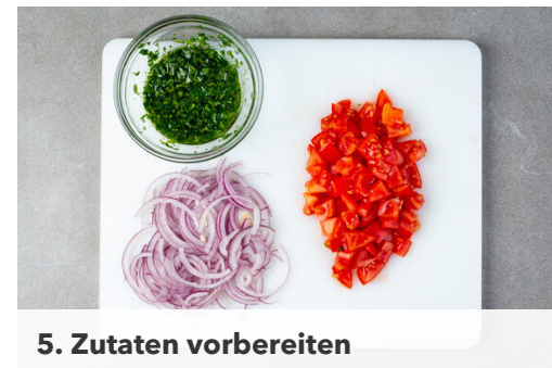
5. Zutaten vorbereiten

Die Karotte ggf. schälen und leicht schräg in hauchdünne Scheiben schneiden. Den Knoblauch schälen und fein würfeln.