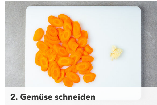
2. Gemüse schneiden

Die Involtini mit je 1 Prise Salz und Pfeffer würzen und in einer mittelgroßen Pfanne mit 1EL Olivenöl bei mittlerer Hitze rundum 2-3Min. anbraten. Die Karotten und den Knoblauch in einer Auflaufform verteilen, die Involtini auf das Gemüse legen und alles 8-10Min. im Ofen backen.