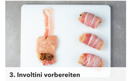
3. Involtini vorbereiten

Die Petersilie samt Stängeln fein hacken, mit 2EL Olivenöl verrühren und mit Salz und Pfeffer würzen. Die Zwiebel schälen, halbieren und in feine Streifen schneiden. Die Tomaten in kleine Würfel schneiden und mit Salz und Pfeffer würzen.