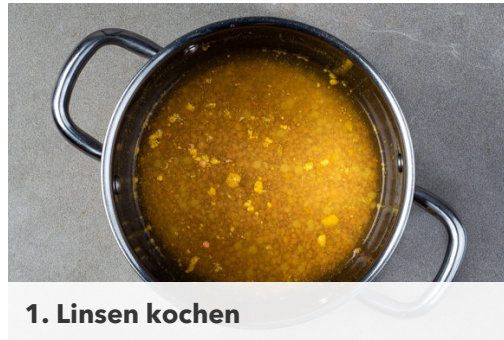
1. Linsen kochen

Energie 1035kcal, Fett 46.9g, Kohlenhydrate 87.2g, Eiweiß 58.4g