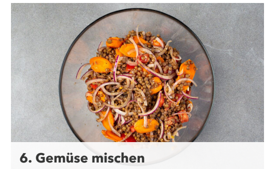
6. Gemüse mischen

Das Fleisch trocken tupfen und horizontal halbieren. Jedes Stück noch einmal der Länge nach durchschneiden und auf je 1 Scheibe Bacon legen. Mit den getrockneten Aprikosen belegen und das Fleisch fest zu kleinen Rouladen aufrollen. Tipp: Wer mag, kann die Involtini mit Zahnstochern fixieren.