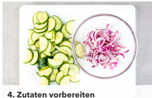
4. Zutaten vorbereiten

Die Korianderblätter von den Stängeln zupfen, fein schneiden und mit der Wasabipaste , 1EL Essig und 1EL Mayonnaise zu einem Dressing verrühren. Tipp: Die Stängel einfrieren und das nächste Chili damit verfeinern. Die Hefebrötchen in den mit Backpapier ausgelegten Dampfbehälter geben und ca. 7Min. abgedeckt dämpfen.