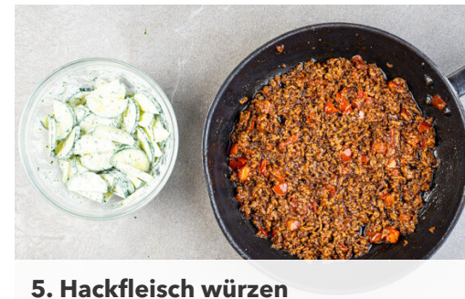
5. Hackfleisch würzen

Die Zwiebel schälen, halbieren und in feine Streifen schneiden, dann mit 1EL Essig, 1TL Zucker und ½TL Salz vermengen. Die Gurke längs halbieren und quer in dünne Scheiben schneiden.