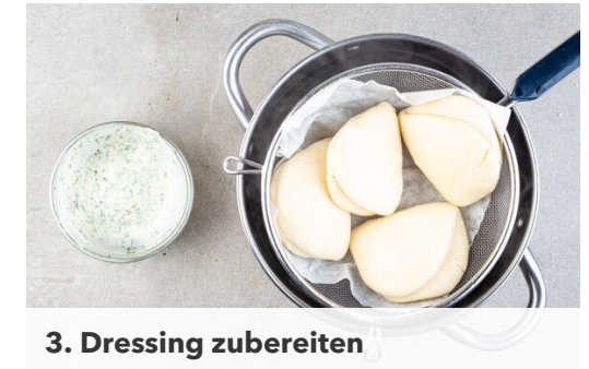
3. Dressing zubereiten

Das Hackfleisch in einer mittelgroßen Pfanne mit 1EL Pflanzenöl bei mittlerer Hitze in 4-6Min. goldbraun anbraten. Die Tomaten , die Hoisinsauce und 30ml Wasser hinzugeben und bei niedriger Hitze ca. 10Min. einköcheln lassen. Bei Bedarf etwas mehr Wasser hinzufügen.