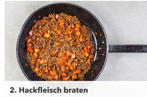
2. Hackfleisch braten

Einen großen Topf mit Wasser bis unter den Dampfkorb füllen und das Wasser zum Kochen bringen. Tipp: Statt dem Dampfkorb kann auch ein passendes Sieb verwendet werden. Die Tomate in ca. 1cm große Würfel schneiden.