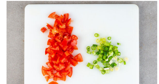
3. Salsa vorbereiten

Die Süßkartoffelwürfel und die Karottenscheiben in das kochende Wasser geben und in 10-12Min. gar kochen.