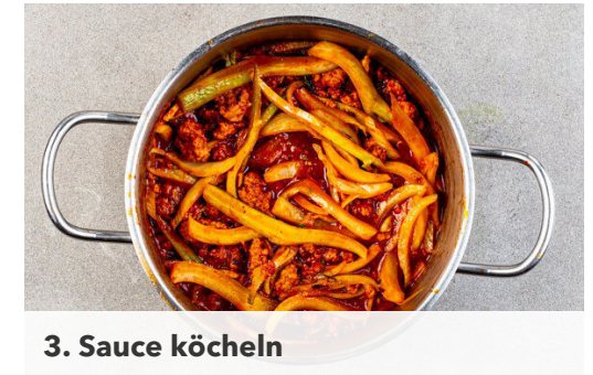
3. Sauce köcheln

Inzwischen die Basilikumblätter abzupfen und grob schneiden. Die Stängel fein schneiden und unter die Sauce rühren. Die Kirschtomaten halbieren. Den Käse mit einem Sparschäler in dünne Scheiben hobeln.