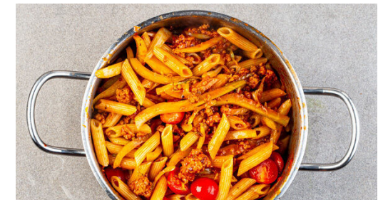
6. Fertigstellen & servieren

Den Fenchel , den Knoblauch und das Tomatenmark zu dem Hackfleisch geben und ca. 1Min. mitbraten, bis das Tomatenmark etwas am Boden ansetzt. 400ml Wasser, 1TL Salz und 1TL Zucker dazugeben und alles bei mittlerer Hitze 9-10Min. köcheln lassen, bis der Fenchel gar und die Sauce eingedickt ist. Ggf. mehr Wasser zugeben und mit Salz und Pfeffer abschmecken.