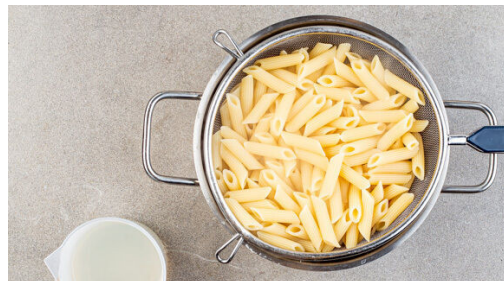
4. Pasta kochen

In einem großen Topf ausreichend gesalzenes Wasser für die Pasta zum Kochen bringen. Den Fenchel längs halbieren, dabei den harten Strunk und die Stängel entfernen und den Fenchel in feine Streifen schneiden. Den Knoblauch schälen und fein würfeln.