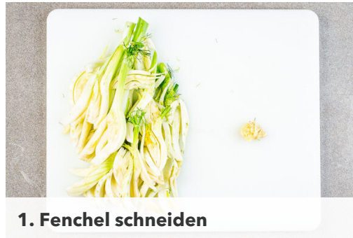
1. Fenchel schneiden

Energie 757kcal, Fett 25.4g, Kohlenhydrate 87.2g, Eiweiß 42.2g