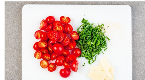
5. Zutaten vorbereiten

Das Hackfleisch und 1-2TL Fenchelsamen in einem zweiten großen Topf mit 1EL Olivenöl bei mittlerer bis starker Hitze 3-4Min. anbraten, bis das Hackfleisch gebräunt ist. Dabei regelmäßig umrühren.