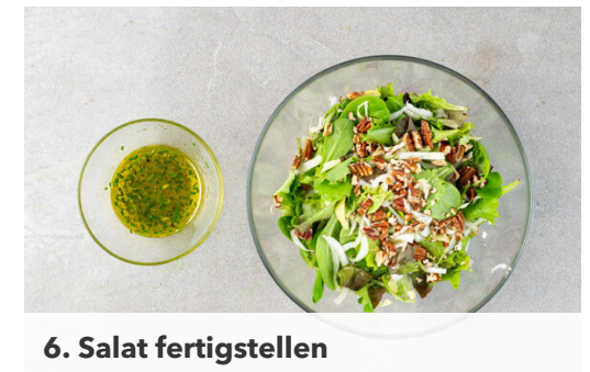
6. Salat fertigstellen

Die Teige mit dem Papier nach unten auf zwei Backblechen ausrollen und gleichmäßig mit der Crème fraîche bestreichen.