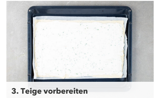
3. Teige vorbereiten

Den übrigen Schnittlauch mit je 2EL Olivenöl, Essig und Wasser sowie je 1 Prise Salz und Zucker zu einem Dressing verrühren.