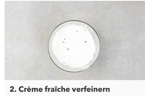
2. Crème fraîche verfeinern

Die Teige mit den Birnen , den Zwiebeln und dem Speck belegen, dann den Käse darüberreiben. Die Flammkuchen ca. 15Min. im Ofen backen, bis der Teig goldbraun und knusprig ist. Je nach Ofen die Position der Bleche nach der Hälfte der Zeit tauschen.