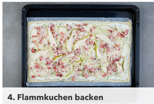
4. Flammkuchen backen

Den Backofen auf 240°C (220°C Umluft) vorheizen. Die Birnen vierteln, entkernen und der Länge nach in dünne Scheiben schneiden. Die Zwiebeln schälen, halbieren und in feine Streifen schneiden. Den Schnittlauch in kleine Röllchen schneiden.