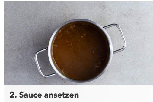
2. Sauce ansetzen

Wenn die Sauce 5-6Min. gekocht hat, die Karotten und den Weißkohl zugeben und ca. 6Min. abgedeckt in der Sauce garen. Das Gemüse sollte noch etwas Biss haben. Die Sauce mit Salz abschmecken.