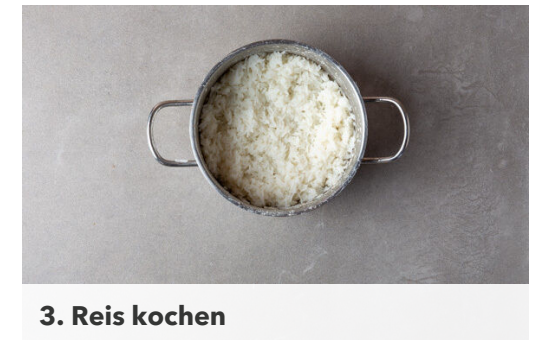
3. Reis kochen

Auf einem tiefen Teller 4EL Mehl mit dem übrigen Currypulver , je 1 kräftigen Prise Salz und Pfeffer sowie 150ml Wasser zu einem glatten Teig verrühren. Auf einem zweiten Teller das Panko-Paniermehl mit dem Sesam vermengen. Das Fleisch trocken tupfen und in ca. 2cm breite Streifen schneiden, anschließend zum Panieren durch den Teig ziehen und im Panko-Sesam-Mix wenden.