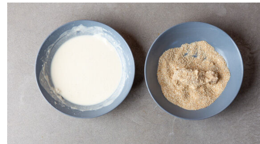
5. Fleisch vorbereiten

Die Zwiebeln und den Knoblauch in einem mittelgroßen Topf mit 1EL Pflanzenöl bei mittlerer Hitze 2-3Min. anschwitzen. 2EL Mehl unterrühren, dann mit 300ml Wasser, der Hoisinsauce und dem Ketjap Manis ablöschen. Die ½ des Currypulvers unterrühren und die Sauce 5-6Min. auf niedriger Hitze sanft köcheln lassen.