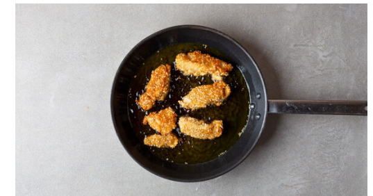
6. Fleisch braten

Währenddessen in einem zweiten mittelgroßen Topf 600ml leicht gesalzenes Wasser zum Kochen bringen. Den Reis in einem Sieb kalt abspülen, bis das Wasser klar bleibt. Sobald das Wasser kocht, den Reis hineingeben und abgedeckt bei niedrigster Hitze 10-12Min. kochen, bis das Wasser aufgesogen und der Reis gar ist. Noch ca. 5Min. ohne Hitzezufuhr ziehen lassen.