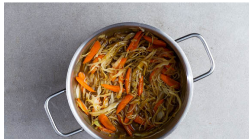
4. Gemüse garen

Die Zwiebeln und den Knoblauch schälen, halbieren und in feine Würfel schneiden. Die Karotten ggf. schälen, längs halbieren und schräg in dünne Scheiben schneiden. Die Lauchzwiebeln in feine Ringe schneiden.