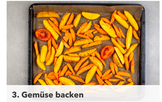
3. Gemüse backen

Die Karotten ggf. schälen und schräg in dünne Scheiben schneiden. Die Tomaten vierteln.