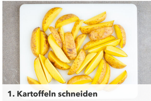
1. Kartoffeln schneiden

Energie 669kcal, Fett 31.4g, Kohlenhydrate 57.4g, Eiweiß 36.7g