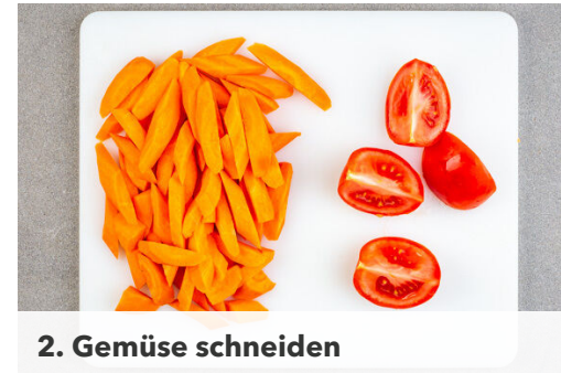
2. Gemüse schneiden

Den Backofen auf 240°C (220°C Umluft) vorheizen. Die Kartoffeln samt Schale in ca. 2cm breite Spalten schneiden. Tipp: Wer möchte, kann die Kartoffeln auch schälen.