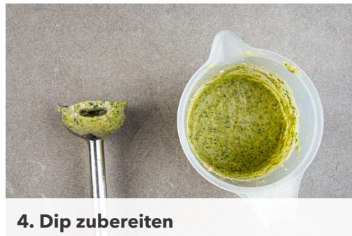
4. Dip zubereiten

Die Kartoffeln , die Karotten und 6 Tomatenspalten auf einem oder zwei mit Backpapier ausgelegten Backblechen verteilen, dann mit dem Kreuzkümmel , dem Paprikapulver , 2EL Olivenöl sowie je 1 kräftigen Prise Salz und Pfeffer vermengen. Das Gemüse im Ofen 20-25Min. backen, bis es appetitlich gebräunt ist. Ggf. die Position der Bleche nach der Hälfte der Garzeit tauschen.