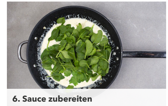
6. Sauce zubereiten

Das Fleisch in einer zweiten großen Pfanne mit 1EL Olivenöl bei starker Hitze rundum 3-4Min. anbraten. Anschließend das Fleisch aus der Pfanne nehmen und auf einem Teller abgedeckt ruhen lassen.