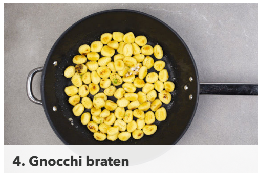
4. Gnocchi braten

Die Limettenschale abreiben, dann die Limette halbieren und auspressen.