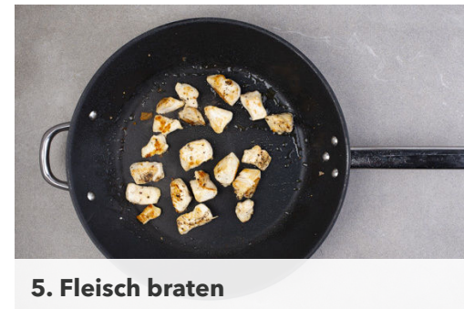
5. Fleisch braten

Die Gnocchi in einer großen Pfanne mit 1EL Olivenöl bei mittlerer Hitze 8-10Min. goldbraun anbraten. Mit Salz und Pfeffer sowie Limettenschale und Limettensaft nach Geschmack würzen.