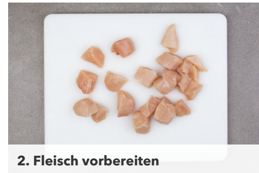
2. Fleisch vorbereiten

Die Zwiebel schälen, halbieren und in feine Streifen schneiden. Den Knoblauch schälen und in feine Scheibchen schneiden.