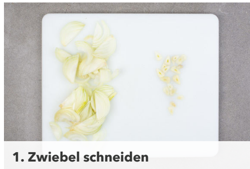
1. Zwiebel schneiden

Energie 952kcal, Fett 44.0g, Kohlenhydrate 93.3g, Eiweiß 46.0g