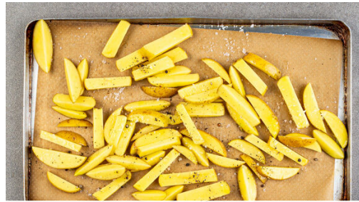
1. Pommes backen

Energie 1409kcal, Fett 97.4g, Kohlenhydrate 91.6g, Eiweiß 46.8g