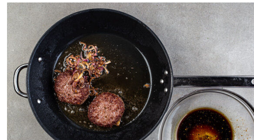
5. Pattys braten

Den Dill samt Stängeln fein schneiden. 1 Zwiebel schälen, halbieren und in dünne Streifen schneiden, die übrige Zwiebel fein würfeln. Die Zwiebelwürfel mit dem Dill , 8EL Mayonnaise, 2TL Senf, 1TL hellem Essig und je 1 kräftigen Prise Salz und Pfeffer verrühren. Die Remoulade bis zum Servieren im Kühlschrank kalt stellen.