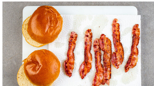
4. Bacon braten

Den Backofen auf 240°C (220°C Umluft) vorheizen. Die Kartoffeln samt Schale in pommesartige Stifte schneiden, mit 2EL Olivenöl und ½TL Salz auf zwei mit Backpapier ausgelegten Backblechen vermengen und gleichmäßig verteilen. Im Ofen 25-30Min. backen, bis die Pommes goldbraun und knusprig sind. Zur Hälfte der Zeit einmal wenden und die Position der Bleche tauschen.