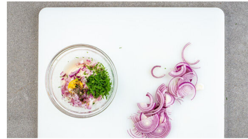
2. Remoulade zubereiten

Den Bacon in einer großen Pfanne ohne Zugabe von Fett bei mittlerer bis starker Hitze ca. 1Min. auf jeder Seite knusprig braten, dann auf etwas Küchenkrepp beiseitestellen und die Pfanne aufbewahren. Die Burgerbrötchen aufschneiden und mit der Schnittfläche nach oben auf den Pommes oder einem Backrost für die letzten ca. 3Min. der Backzeit aufbacken.