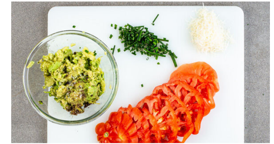
3. Zutaten vorbereiten

Die Rindfleischpattys in derselben Pfanne mit 2EL Olivenöl bei mittlerer bis starker Hitze auf jeder Seite 3-4Min. gar braten, dabei die Zwiebelstreifen mit 1 kräftigen Prise Salz um die Pattys verteilen und mitbraten. 2EL Olivenöl, 2EL Balsamicoessig, 1TL Honig und je 1 kräftige Prise Salz und Pfeffer zu einem Dressing verrühren.