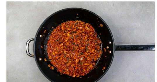
6. Sauce einköcheln

Die Pinienkerne in einer großen Pfanne ohne Zugabe von Fett bei mittlerer Hitze 1-2Min. goldbraun anrösten. Vorsicht , sie können schnell zu dunkel werden. Zum Abkühlen aus der Pfanne nehmen. In derselben Pfanne 1EL Butter schmelzen und 2-3Min. warten, bis die Butter braun wird und ein nussiges Aroma verströmt. Die Butter und den fein gewürfelten Knoblauch unter den Joghurt rühren.