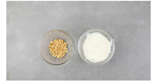
3. Pinienkerne anrösten

Die Zwiebeln und den restlichen Knoblauch mit 1EL Olivenöl in der Pfanne bei mittlerer Hitze 1-2Min. anschwitzen. Das Hackfleisch mit je 1 kräftigen Prise Salz und Pfeffer dazugeben und 5-7Min. anbraten. Die Gurke längs halbieren, dann quer in dünne Scheiben schneiden und mit 2TL Olivenöl, 1EL Essig sowie je 1 Prise Salz und Pfeffer vermengen.