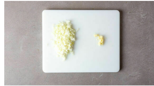
2. Zwiebel & Knobi schneiden

Die Gnocchi auf einem zweiten mit Backpapier ausgelegten Backblech mit 2EL Olivenöl sowie je 1 kräftigen Prise Salz und Pfeffer vermengen. Wenn die Auberginen ca. 10Min. geröstet haben, die Gnocchi über den Auberginen in den Ofen schieben und alles weitere 8-10Min. rösten, bis die Auberginenwürfel weich und die Gnocchi knusprig sind.