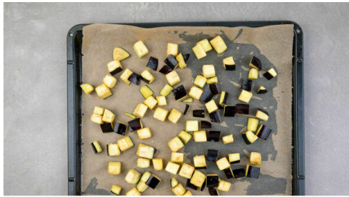
1. Auberginen rösten

Energie 1031kcal, Fett 51.2g, Kohlenhydrate 99.4g, Eiweiß 42.9g