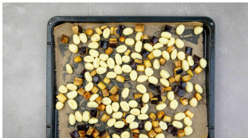
4. Gnocchi rösten

Den Backofen auf 240°C (220°C Umluft) vorheizen. Die Auberginen in 1-2cm große Würfel schneiden und mit 2EL Olivenöl sowie je 2 kräftigen Prisen Salz und Pfeffer vermengen. Auf einem mit Backpapier ausgelegten Backblech verteilen und ca. 10Min. im Ofen rösten, bis sie goldbraun sind.