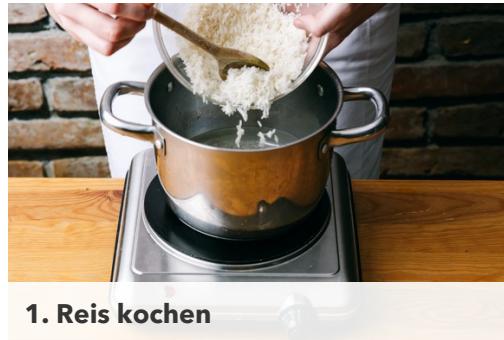
1. Reis kochen

Energie 663kcal, Fett 25.4g, Kohlenhydrate 75.1g, Eiweiß 32.6g