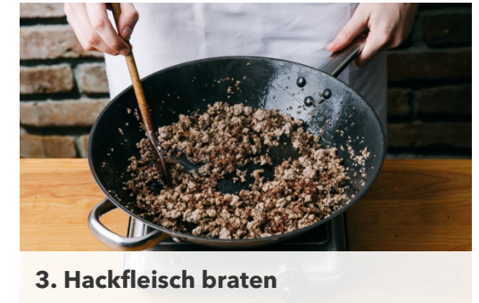
3. Hackfleisch braten

Die Zwiebeln zum Hackfleisch in die Pfanne geben und ca. 1Min. mitbraten. Den Knoblauch , die Chilischote nach Geschmack und das geschnittene Basilikum unterrühren, dann nach und nach den Spinat unterheben, bis dieser zusammengefallen ist. Die Paprikastreifen und die Würzsauce zugeben und alles einmal aufkochen lassen.