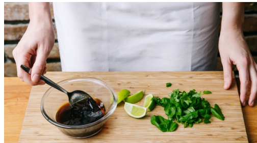
4. Würzsauce zubereiten

In einem mittelgroßen Topf 600ml leicht gesalzenes Wasser zum Kochen bringen. Den Reis in einem Sieb kalt abspülen, bis das Wasser klar bleibt. Sobald das Wasser kocht, den Reis hineingeben und abgedeckt bei niedrigster Hitze 10-12Min. kochen, bis das Wasser aufgesogen und der Reis gar ist. Noch ca. 5Min. ohne Hitzezufuhr ziehen lassen.