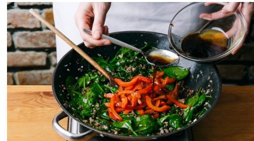
5. Hackpfanne fertigstellen

Die Paprika vierteln, entkernen und in ca. 1cm breite Streifen schneiden. Die Zwiebel und den Knoblauch schälen und fein würfeln. Die Chilischote längs halbieren und in feine Würfel schneiden. Tipp: Für weniger Schärfe die Kerne entfernen.