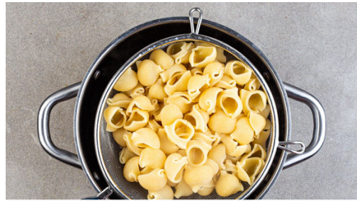
1. Pasta kochen

Energie 1071kcal, Fett 49.0g, Kohlenhydrate 107.5g, Eiweiß 48.0g