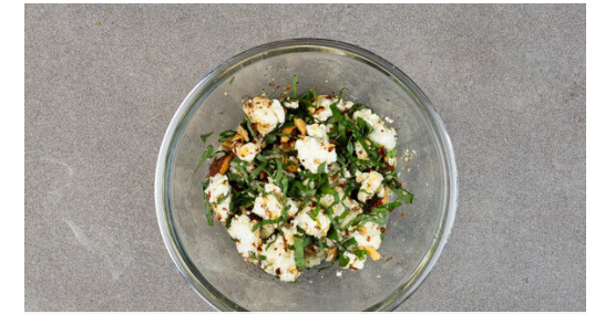
3. Feta vermengen

Den gebackenen Knoblauch schälen und mit der ½ der Paprika , dem restlichen Feta , den Basilikumstängeln , dem Pastawasser und 2EL Balsamicoessig in einem hohen Gefäß mit einem Stabmixer cremig pürieren. Die Sauce mit Salz und Pfeffer abschmecken.