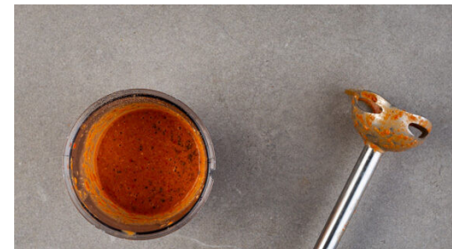
5. Sauce pürieren

Die Paprika jeweils vierteln und entkernen und mit der Schnittfläche nach unten auf ein mit Backpapier ausgelegtes Backblech geben. Den ungeschälten Knoblauch dazulegen und das Gemüse auf der obersten Schiene 8-10Min. grillen, bis die Paprikahaut Blasen wirft.