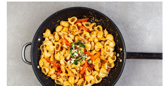
6. Pasta fertigstellen

Die Basilikumblätter von den Stängeln zupfen und fein schneiden. Die Basilikumstängel aufbewahren. Die Rauchmandeln grob hacken. Die ½ des Fetas mit den Fingern oder einer Gabel zerkrümeln und mit dem Basilikum , den Mandeln , 2EL Olivenöl und je 1 kräftigen Prise Salz und Pfeffer vermengen.