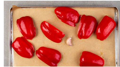
2. Paprika grillen

Das Fleisch in einer großen Pfanne mit 2EL Olivenöl bei mittlerer Hitze 3-5Min. gar und goldbraun braten, dabei gelegentlich umrühren. Mit je 1 kräftigen Prise Salz und Pfeffer würzen.