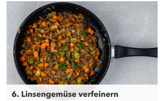
6. Linsengemüse verfeinern

Die Tahinipaste mit dem Joghurt glatt rühren und mit Salz sowie 1 Prise Zucker abschmecken.