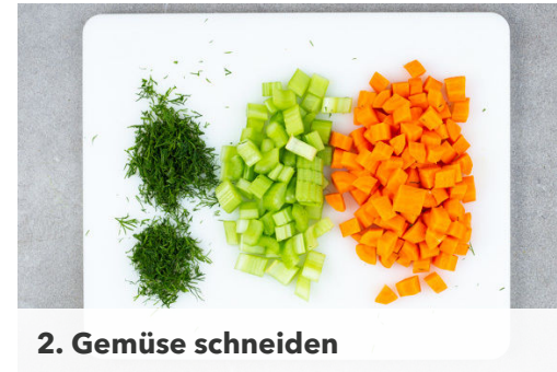
2. Gemüse schneiden

Den Backofen auf 220°C (200°C Umluft) vorheizen. Den Lauch längs vierteln, dann in feine Würfel schneiden. Den Knoblauch schälen und ebenfalls fein würfeln.