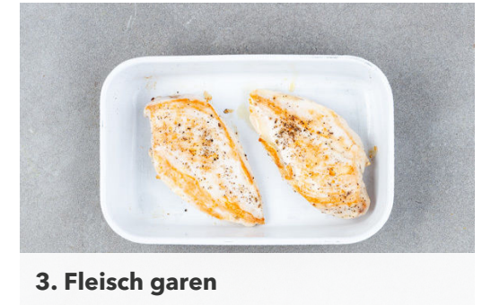
3. Fleisch garen

Die Karotte ggf. schälen, der Länge nach vierteln und in kleine Würfel schneiden. Den Stangensellerie ebenfalls in kleine Würfel schneiden. Den Dill samt Stängeln fein schneiden.