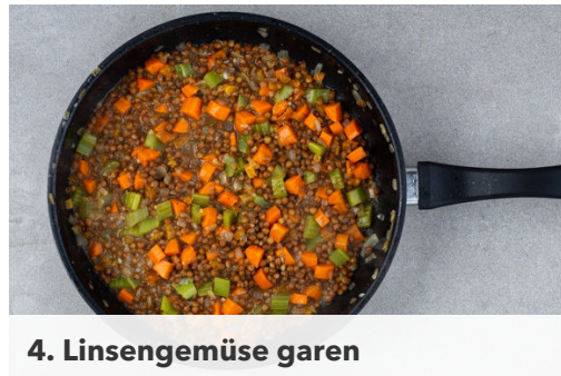
4. Linsengemüse garen

Das Fleisch trocken tupfen, horizontal halbieren und in einer mittelgroßen Pfanne mit 1EL Olivenöl bei starker Hitze auf jeder Seite 1-2Min. scharf anbraten. In eine Auflaufform geben, mit je 1 Prise Salz und Pfeffer würzen und im Ofen 8-10Min. garen, bis das Fleisch in der Mitte durch ist.