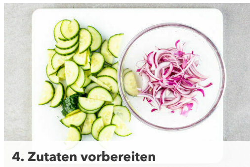
4. Zutaten vorbereiten

Einen großen Topf mit Wasser bis unter den Dampfkorb füllen und das Wasser zum Kochen bringen. Tipp: Statt dem Dampfkorb kann auch ein passendes Sieb verwendet werden. Die Tomaten in ca. 1cm große Würfel schneiden.