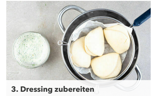
3. Dressing zubereiten

Das Hackfleisch mit Salz und Pfeffer abschmecken. Die Gurken mit dem Dressing vermengen.