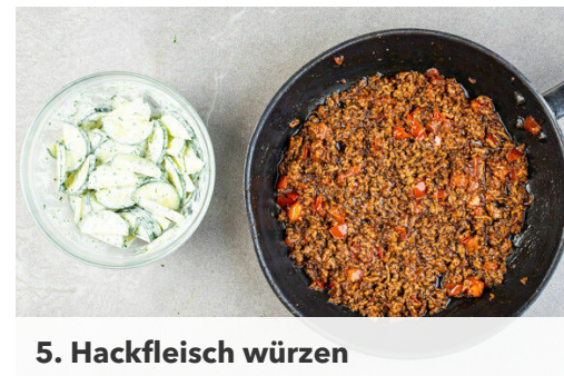
5. Hackfleisch würzen

Das Hackfleisch in einer großen Pfanne mit 2EL Pflanzenöl bei mittlerer Hitze in 4-6Min. goldbraun anbraten. Die Tomaten , die Hoisinsauce und 60ml Wasser hinzugeben und bei niedriger Hitze ca. 10Min. einköcheln lassen. Bei Bedarf etwas mehr Wasser hinzufügen.