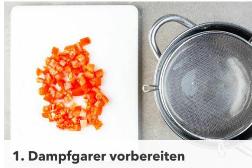
1. Dampfgarer vorbereiten

Energie 844kcal, Fett 44.4g, Kohlenhydrate 74.2g, Eiweiß 35.0g