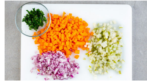
2. Zutaten schneiden

Die Linsen in ein Sieb abgießen, mit kaltem Wasser abspülen, gut abtropfen lassen und zum Gemüse in die Pfanne geben. Kurz unterrühren und die Pfanne vom Herd nehmen.