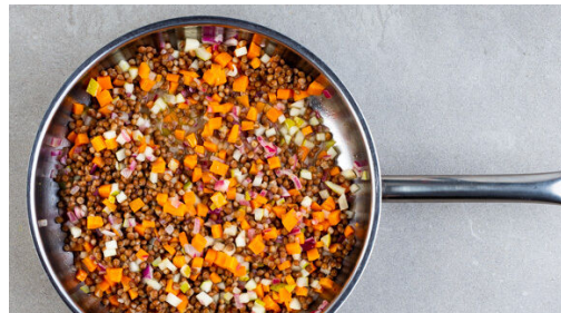
4. Linsen hinzugeben

Die Estragonblätter von den Stängeln zupfen und grob schneiden. Aus 2EL Estragon , 3EL Senf und 1EL Olivenöl eine Marinade anrühren. Das Fleisch trocken tupfen, mit der Marinade einreiben und beiseitestellen.