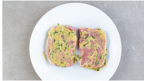
1. Fleisch würzen

Energie 541kcal, Fett 23.4g, Kohlenhydrate 37.2g, Eiweiß 40.1g