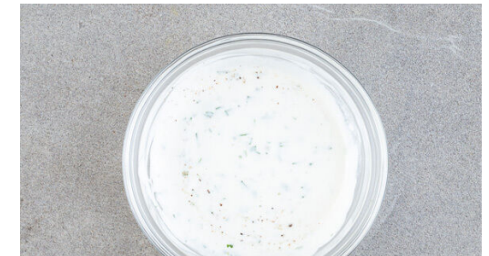
6. Dip zubereiten

Die Zwiebeln und die Karotten in einer großen Pfanne mit 1EL Olivenöl bei mittlerer Hitze 2-3Min. anschwitzen. Die Birnenwürfel , 4EL Wasser und 2EL Essig zugeben, alles mit je ½TL Zucker, Salz und Pfeffer würzen und weitere 1-2Min. dünsten.