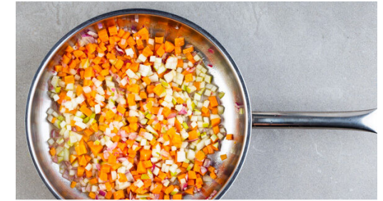
3. Gemüse braten

Das Fleisch aus der Marinade nehmen und trocken tupfen, mit 1EL Olivenöl einreiben und in einer Grillpfanne oder einer normalen Pfanne bei mittlerer Hitze auf jeder Seite 3-4Min. goldbraun anbraten. Mit je ½TL Salz und Pfeffer würzen.