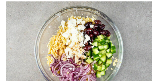
6. Salat mischen

Die Zwiebelwürfel und die Paprika in einer großen Pfanne mit 1EL Olivenöl und 1 kräftigen Prise Salz bei mittlerer Hitze ca. 3Min. unter gelegentlichem Rühren anbraten, bis die Paprika etwas weicher ist. Aus der Pfanne nehmen und in einem hohen Gefäß beiseitestellen.