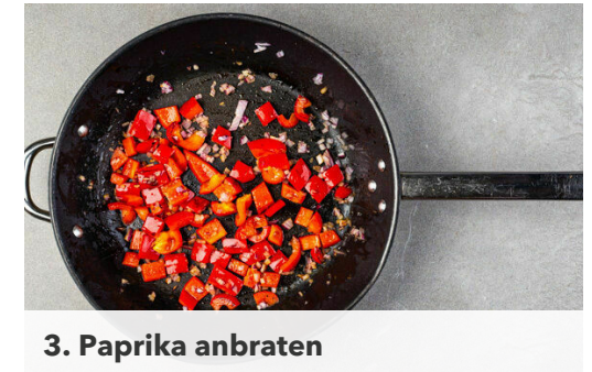
3. Paprika anbraten

2EL Essig und 1 kräftige Prise Salz zu der Paprika und den Zwiebelwürfeln in das hohe Gefäß geben und alles mit einem Stabmixer zu einer groben Salsa pürieren. Dabei nicht zu lange pürieren, die Salsa soll nicht glatt sein, sondern noch ein paar Stücke enthalten.