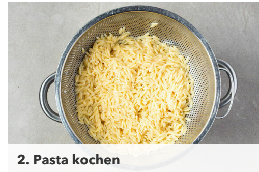
2. Pasta kochen

Das Fleisch in der Pfanne bei starker Hitze auf jeder Seite 2-3Min. braten, abhängig davon, ob es medium oder eher durchgebraten sein soll. Aus der Pfanne nehmen und bis zum Servieren auf einem Teller abgedeckt ruhen lassen. 150ml Wasser in die Pfanne geben, ca. 30Sek. köcheln und eindicken lassen, dann vom Herd nehmen.