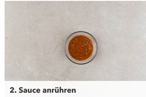
2. Sauce anrühren

Die Nudeln in das kochende Wasser geben und in ca. 5Min. bissfest kochen. Nach ca. 2Min. die Pak-Choi-Blätter zugeben und für mindestens 3Min. im Nudelwasser blanchieren.