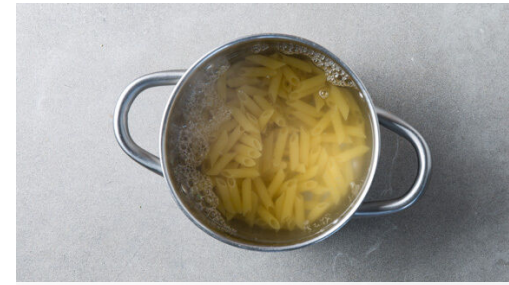
2. Pasta kochen

In einem großen Topf ausreichend gesalzenes Wasser für die Pasta zum Kochen bringen. Die Pilze ggf. säubern und je nach Größe vierteln oder sechsteln. Die Zwiebeln schälen, halbieren und in feine Streifen schneiden.