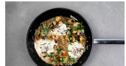
6. Abschmecken und servieren

Die Pilze in derselben Pfanne mit 1EL Olivenöl bei mittlerer Hitze 3-5Min. anbraten. Die Zwiebeln hinzufügen und 1-2Min. mitbraten. 1EL Mehl unterrühren und mit 200-300ml Wasser ablöschen. Die ½ des Brühwürzes in der Sauce auflösen, dann die Crème fraîche und das Fleisch hinzugeben und das Geschnetzelte 1-2Min. köcheln lassen.