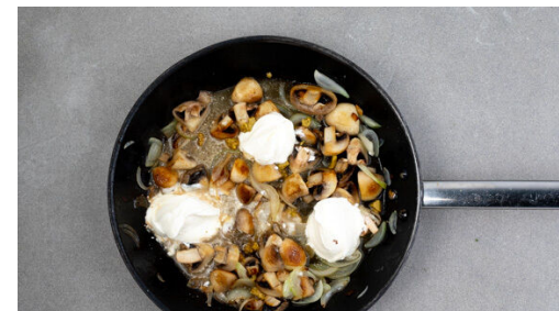
5. Geschnetzeltes zubereiten

Das Fleisch in einer großen Pfanne mit 2EL Olivenöl bei starker Hitze 3-4Min. goldbraun anbraten. Aus der Pfanne nehmen und beiseitestellen.