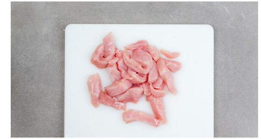
3. Fleisch vorbereiten

Die Pasta in das kochende Wasser geben und in 8-10Min. bissfest kochen. In ein Sieb abgießen und abtropfen lassen, dann die Pasta wieder in den Topf geben und abgedeckt warm halten.