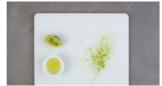
3. Limette vorbereiten

Das Fleisch in einem großen Topf mit 1EL Pflanzenöl bei starker Hitze 2-3Min. scharf anbraten. Die Champignons , die Paprika , die Zwiebeln und den Knoblauch zugeben und ca. 2Min. mitbraten, dann mit der Kokosmilch ablöschen und das Curry weitere 3-4Min. bei mittlerer Hitze sanft köcheln lassen, bis das Gemüse gar, aber noch bissfest ist.