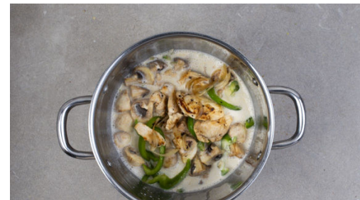
5. Curry kochen

Den Reis in einem Sieb unter fließendem Wasser abspülen, bis das Wasser klar bleibt. Sobald das Wasser kocht, den Reis bei niedrigster Hitze abgedeckt 10-12Min. kochen, bis das Wasser aufgesogen und der Reis gar ist. Noch ca. 5Min. ohne Hitzezufuhr abgedeckt ziehen lassen.