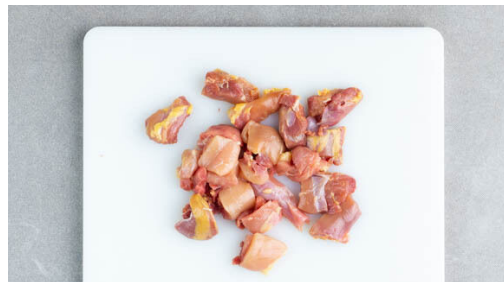
4. Fleisch würzen

In einem kleinen Topf 300ml leicht gesalzenes Wasser für den Reis zum Kochen bringen. Die Champignons ggf. säubern und je nach Größe halbieren oder vierteln. Die Paprika vierteln, entkernen und in dünne Streifen schneiden. Die Zwiebel schälen, halbieren und in feine Streifen schneiden. Den Knoblauch schälen und in feine Scheibchen schneiden.