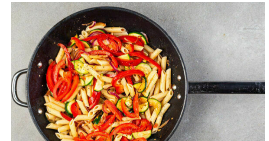
6. Pasta fertigstellen

Die Tomaten vierteln, den Strunk entfernen und das Kerngehäuse ausschneiden. Das Kerngehäuse der Tomaten in einem hohen Gefäß mit einem Stabmixer pürieren und mit je 1 kräftigen Prise Salz und Pfeffer würzen. Das Tomatenfruchtfleisch in Streifen schneiden.