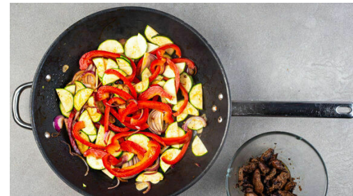
5. Fleisch braten

Die Paprika vierteln, entkernen und in lange, dünne Streifen schneiden. Die Zucchini längs halbieren und quer in dünne Scheiben schneiden. Die Zwiebeln schälen, halbieren und in dünne Streifen schneiden. Den Knoblauch schälen und in feine Scheibchen schneiden.