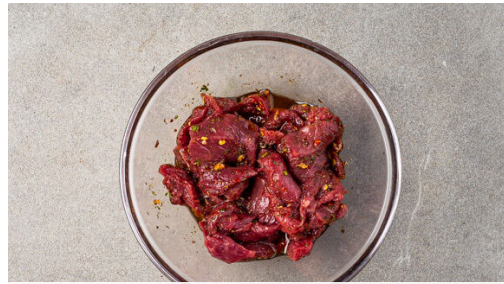
1. Fleisch vorbereiten

Energie 725kcal, Fett 19.7g, Kohlenhydrate 92.7g, Eiweiß 43.0g