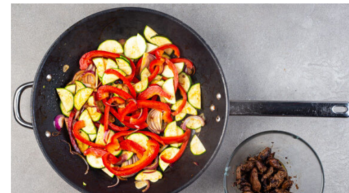
5. Fleisch braten

Die Pasta in das kochende Wasser geben und in 8-10Min. bissfest kochen. Mit einem Messbecher ca. 100ml Pastawasser abschöpfen, dann die Pasta in ein Sieb abgießen und abtropfen lassen.