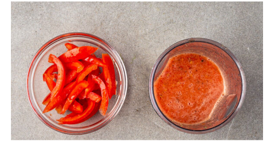
3. Tomatensauce zubereiten

Die Paprika vierteln, entkernen und in lange, dünne Streifen schneiden. Die Zucchini längs halbieren und quer in dünne Scheiben schneiden. Die Zwiebel schälen, halbieren und in dünne Streifen schneiden. Den Knoblauch schälen und in feine Scheibchen schneiden.