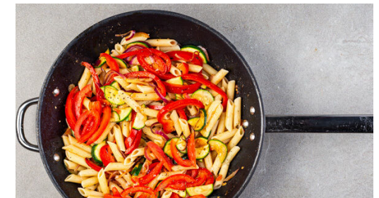
6. Pasta fertigstellen

Das Fleisch in einer großen Pfanne bei starker Hitze ca. 2Min. scharf anbraten, aus der Pfanne nehmen und beiseitestellen. Die Paprika , die Zucchini , die Zwiebeln und den Knoblauch in derselben Pfanne mit 1EL Olivenöl bei mittlerer Hitze 2-3Min. anbraten.