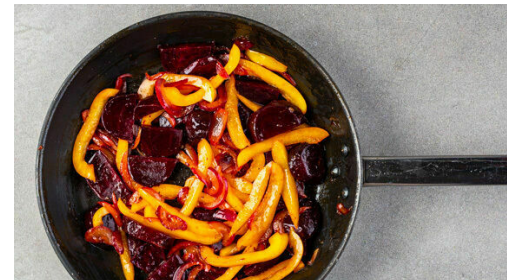
5. Gemüse braten

Die Paprika vierteln, entkernen und in dünne Streifen schneiden. Die Zwiebeln schälen, halbieren und in feine Streifen schneiden. Die Rote Bete jeweils halbieren und in dünne Scheiben schneiden. Tipp: Da Rote Bete stark färbt, beim Verarbeiten am besten Küchenhandschuhe und Schürze tragen. Die Schale einer Orange abreiben, dann die Orangen halbieren und auspressen.