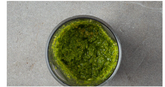
3. Pesto zubereiten

Die Zucchini längs halbieren und quer in dünne Scheiben schneiden. Die Paprika vierteln, entkernen und in dünne Streifen schneiden. Die Tomate vierteln, dabei die Kerne entfernen und das Fruchtfleisch in dünne Streifen schneiden.