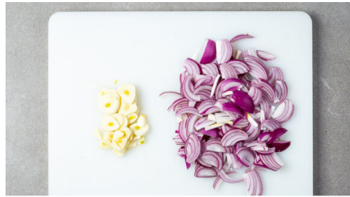
1. Zwiebeln schneiden

Energie 763kcal, Fett 57.6g, Kohlenhydrate 24.8g, Eiweiß 37.1g