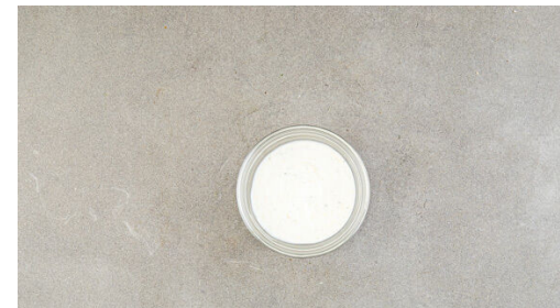
5. Dip zubereiten

Den Blumenkohl , die Süßkartoffeln , die Karotten und den Knoblauch samt Schale auf zwei mit Backpapier ausgelegten Backblechen mit je 2EL Olivenöl und 1 kräftigen Prise Salz vermengen und im Ofen ca. 5Min. vorbacken. Inzwischen die Zitronenschale abreiben, die Zitrone halbieren, dann eine Hälfte auspressen und die andere Hälfte in Spalten schneiden.