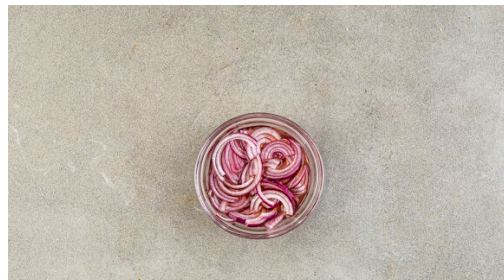
4. Zwiebeln einlegen

Den Backofen auf 240°C (220°C Umluft) vorheizen. Den Blumenkohl in mundgerechte Röschen zerkleinern. Die Süßkartoffeln ggf. schälen und in ca. 1cm breite Spalten schneiden. Die Karotten ggf. schälen und schräg in dünne Scheiben schneiden.