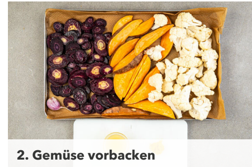
2. Gemüse vorbacken

2EL Essig, 1EL Wasser, 1TL Honig und ½TL Salz gut verrühren. Die Zwiebel schälen, halbieren, in feine Streifen schneiden und mit dem Einlegesud vermengen.