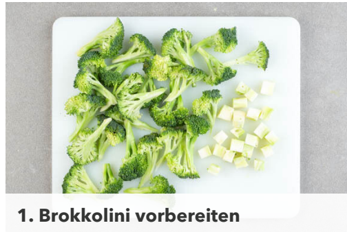
1. Brokkolini vorbereiten

Energie 646kcal, Fett 20.4g, Kohlenhydrate 86.5g, Eiweiß 23.3g