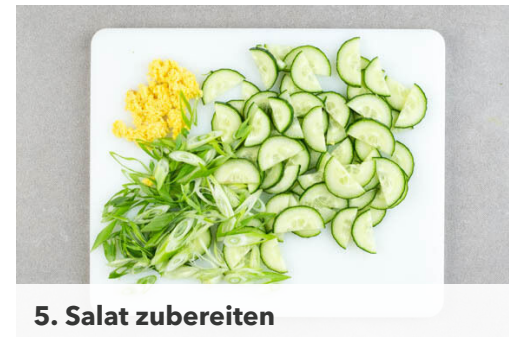
5. Salat zubereiten

Den Tofu in einer großen Pfanne mit 3EL Pflanzenöl bei starker Hitze in 5-7Min. rundum goldbraun anbraten.