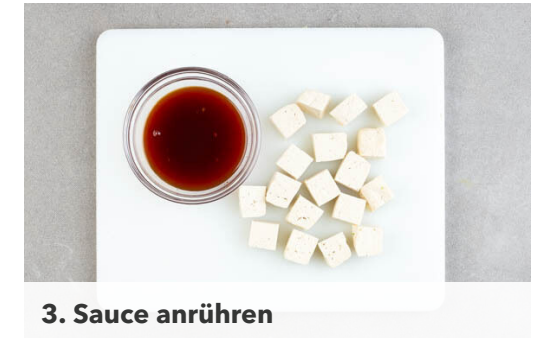
3. Sauce anrühren

Den Reis in das kochende Wasser und die Brokkolini in den Dämpfeinsatz oder das Sieb geben und abgedeckt bei niedrigster Hitze kochen. Den Dämpfeinsatz oder das Sieb mit den Brokkolini nach 5-6Min. Kochzeit entfernen. Den Reis weitere 5-6Min. garen, bis der Reis das Wasser aufgesogen hat. Anschließend noch ca. 5Min. ohne Hitzezufuhr ziehen lassen.