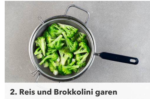
2. Reis und Brokkolini garen

In einem großen Topf mit Dämpfeinsatz oder passendem Sieb 600ml leicht gesalzenes Wasser zum Kochen bringen. Den Reis in einem Sieb kalt abspülen, bis das Wasser klar bleibt. Ggf. die Enden der Brokkolini abschneiden.