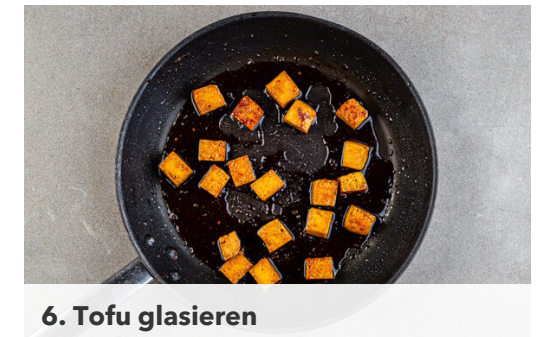
6. Tofu glasieren

Den Ingwer schälen und fein reiben. Die Gurke längs halbieren und quer in dünne Scheiben schneiden. Die Lauchzwiebeln schräg in feine Ringe schneiden. Den restlichen Reisessig mit dem Sesamöl , dem Ingwer sowie je 1 kräftigen Prise Salz, Pfeffer und Zucker verrühren. Die Gurken und die Lauchzwiebeln mit dem Dressing vermengen.