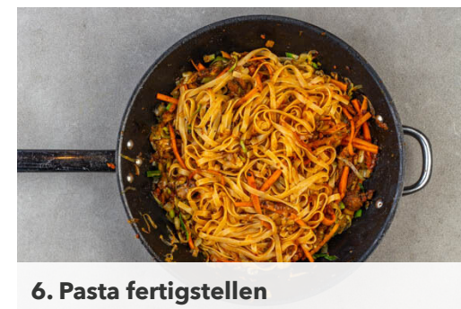
6. Pasta fertigstellen

Die Pasta in das kochende Wasser geben und in 7-9Min. bissfest kochen. Mit einer Tasse etwas Pastawasser abschöpfen, dann die Pasta in ein Sieb abgießen und abtropfen lassen.