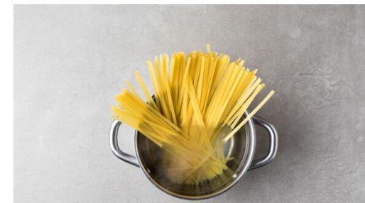
3. Pasta kochen

Die Garnelen zum Gemüse in die Pfanne geben und ca. 2Min. mitbraten, bis die Garnelen gar sind. Mit Salz abschmecken.