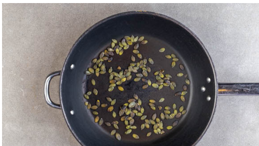
1. Kürbiskerne anrösten

Energie 911kcal, Fett 42.5g, Kohlenhydrate 91.1g, Eiweiß 37.1g