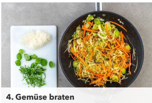
4. Gemüse braten

In einem mittelgroßen Topf ausreichend gesalzenes Wasser für die Pasta zum Kochen bringen. Die Kürbiskerne in einer großen Pfanne ohne Zugabe von Fett 2-4Min. anrösten, bis sie knistern und goldbraun sind. Zum Abkühlen aus der Pfanne nehmen. Die Pfanne aufbewahren.