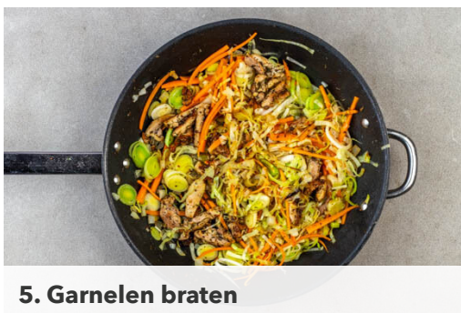
5. Garnelen braten

Die Garnelen in einem Sieb kalt abspülen und abtropfen lassen, dann trocken tupfen.