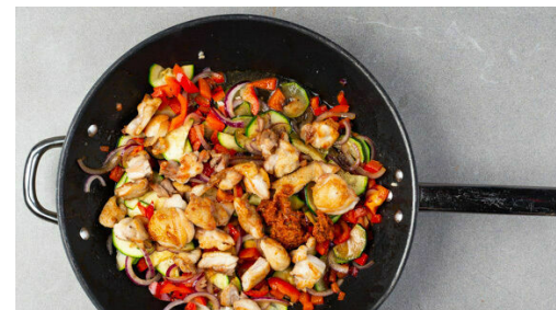
5. Gemüse braten

Das Fleisch in der Pfanne mit 2EL Olivenöl bei mittlerer Hitze 5-6Min. braten, bis es goldbraun und fast gar ist. Auf einem Teller beiseitestellen, die Pfanne nicht auswischen.