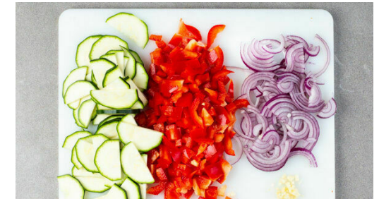
3. Gemüse schneiden

Die Zucchini und die Paprika in der Pfanne mit 2EL Olivenöl 3-5Min. anbraten, bis das Gemüse leicht gebräunt ist. Die Zwiebeln , den Knoblauch und das Fleisch dazugeben, mit ½TL Salz würzen und erneut ca. 2Min. braten. Die Basilikumblätter von den Stängeln zupfen und 2/3 der Blätter grob schneiden. Den Käse fein reiben.