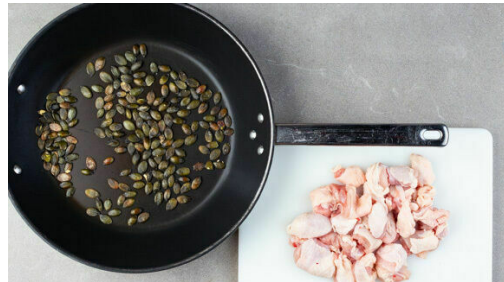
1. Kürbiskerne anrösten

Energie 870kcal, Fett 33.8g, Kohlenhydrate 87.7g, Eiweiß 50.4g