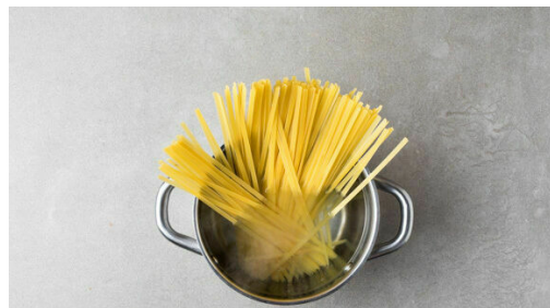
4. Pasta kochen

Die Kürbiskerne in einer großen Pfanne ohne Zugabe von Fett 2-4Min. anrösten, bis sie knistern und goldbraun sind. Zum Abkühlen aus der Pfanne nehmen. Das Fleisch trocken tupfen und in 2-3cm große Würfel schneiden. In einem großen Topf ausreichend gesalzenes Wasser für die Pasta zum Kochen bringen.