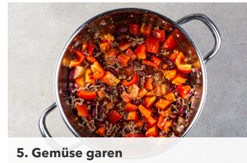
5. Gemüse garen

Inzwischen die Tomaten in ca. 1cm große Würfel schneiden. Die Paprika vierteln, entkernen und in ca. 1cm große Stücke schneiden.