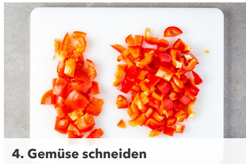
4. Gemüse schneiden

Die Zwiebeln und das Hackfleisch in einem großen Topf mit 1EL Pflanzenöl bei mittlerer Hitze 2-3Min. anbraten, bis das Hackfleisch braun und krümelig ist. Die Gewürzmischungen und den Knoblauch dazugeben und ca. 2Min. mitbraten.