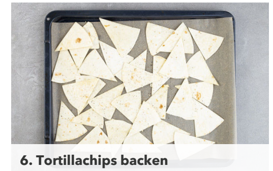
6. Tortillachips backen

Die Tomaten und die Paprika in den Topf geben und ca. 1Min. mitbraten, dann mit je 1 Prise Salz und Pfeffer würzen. Die Bohnen , das Brühgewürz und 200ml Wasser hinzufügen, aufkochen und dann bei mittlerer Hitze 10-12Min. köcheln lassen, bis das Gemüse weich ist. Ggf. mehr Wasser zugeben, falls die Sauce zu dickflüssig ist. Mit 2EL Essig sowie Salz und Pfeffer abschmecken.