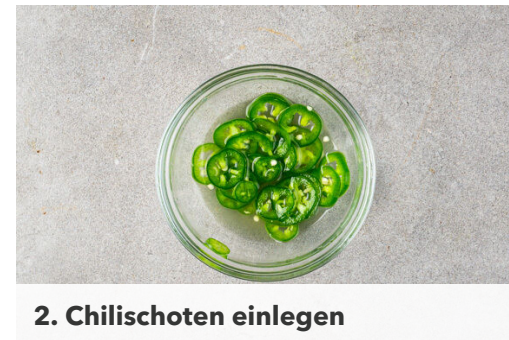
2. Chilischoten einlegen

Den Backofen auf 200°C (180°C Umluft) vorheizen. Den Knoblauch schälen und fein würfeln. Die Zwiebeln schälen, halbieren und ebenfalls fein würfeln. Die Bohnen in einem Sieb mit kaltem Wasser abspülen und abtropfen lassen.