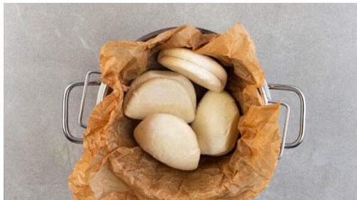
4. Hefebrötchen dämpfen

Einen großen Topf mit Wasser bis unter den Dampfkorb füllen und das Wasser zum Kochen bringen. Tipp: Statt dem Dampfkorb kann auch ein passendes Sieb verwendet werden. Die Zwiebeln schälen, halbieren und in dünne Streifen schneiden. Den Rotkohl mit je ½TL Salz und Zucker massieren, mit den Zwiebeln und 4EL Essig vermengen und mit Salz und Pfeffer abschmecken.