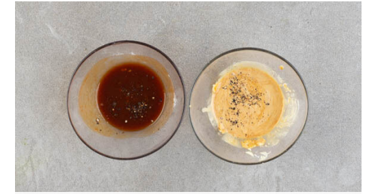
3. Saucen anrühren

Das Fleisch aus der Pfanne nehmen und auf etwas Küchenkrepp abtropfen lassen, die Pfanne auswischen. Das Fleisch in ca. 1cm dicke Scheiben schneiden und zurück in die Pfanne geben. Mit der Würzsauce begießen und bei mittlerer Hitze 30Sek.-1Min. braten, bis die Sauce eingedickt ist, dann mit dem Sesam bestreuen.