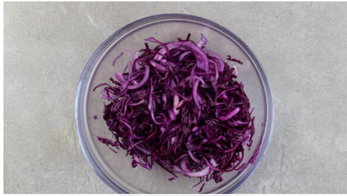
1. Rotkohl würzen

Energie 853kcal, Fett 44.7g, Kohlenhydrate 78.9g, Eiweiß 28.2g