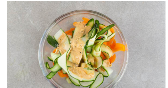
6. Salat zubereiten

Die BBQ-Sauce mit der ½ der Sojasauce , 2TL Honig, 2TL Mehl, 2EL Wasser und 1 kräftigen Prise Pfeffer zu einer Würzsauce verrühren. Den Knoblauch schälen, fein würfeln und mit der restlichen Sojasauce , 2EL Mayonnaise und 1 kräftigen Prise Pfeffer zu einem Dressing verrühren.