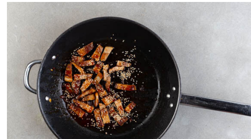
5. Fleisch glasieren

Das Fleisch trocken tupfen und in einer großen Pfanne mit 1EL Pflanzenöl bei mittlerer bis starker Hitze ca. 10Min. anbraten, dabei regelmäßig wenden. Anschließend bei starker Hitze 2-4Min. weiterbraten, bis das Fleisch appetitlich gebräunt und knusprig ist, dabei wieder gelegentlich wenden.