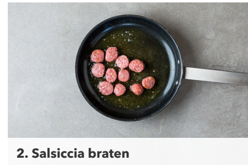
2. Salsiccia braten

In einem mittelgroßen Topf ausreichend gesalzenes Wasser für die Pasta zum Kochen bringen. Die Pasta in das kochende Wasser geben und in 8-10Min. bissfest kochen. Mit einer Tasse etwas Pastawasser abschöpfen, dann in ein Sieb abgießen und abtropfen lassen.