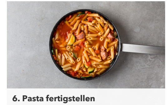
6. Pasta fertigstellen

Die Pinienkerne in einer kleinen Pfanne bei mittlerer Hitze ohne Zugabe von Fett 1-2Min. goldbraun anrösten. Zum Abkühlen auf einem Teller beiseitestellen.