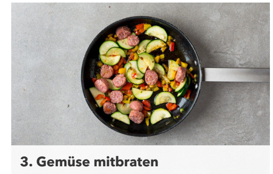
3. Gemüse mitbraten

Die Salsiccia von der Haut befreien und in ca. 1cm dicke Scheiben schneiden. In einer großen Pfanne mit 1EL Olivenöl bei mittlerer Hitze 2-3Min. rundum goldbraun anbraten.