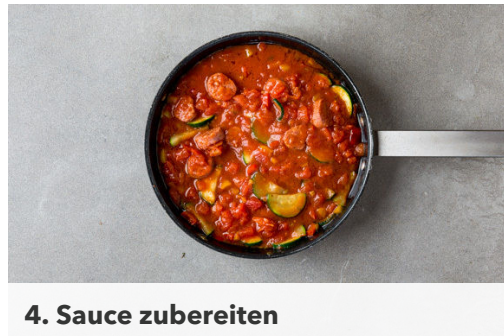
4. Sauce zubereiten

Die Paprika vierteln, entkernen und in kleine Würfel schneiden. Die Zucchini längs halbieren und in dünne Scheiben schneiden. Das Gemüse zur Salsiccia in die Pfanne geben und 3-4Min. mitbraten, dann mit der Gewürzmischung nach Geschmack würzen.