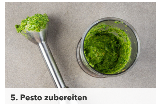
5. Pesto zubereiten

Die Sonnenblumenkerne in einer großen Pfanne ohne Zugabe von Fett bei mittlerer Hitze 1-2Min. goldbraun anrösten. Vorsicht , sie können schnell zu dunkel werden. Zum Abkühlen aus der Pfanne nehmen und beiseitestellen. Das Fleisch in der Pfanne mit 2EL Olivenöl bei mittlerer bis starker Hitze 3-4Min. goldbraun anbraten.