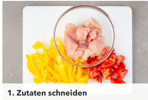
1. Zutaten schneiden

Energie 951kcal, Fett 47.3g, Kohlenhydrate 85.8g, Eiweiß 45.0g