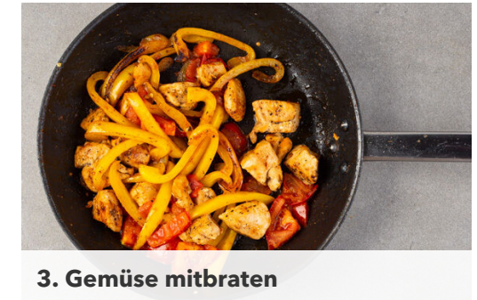
3. Gemüse mitbraten

Den Käse fein reiben. Den Knoblauch schälen, grob würfeln und mit dem Käse , der ½ des Spinats und den Sonnenblumenkernen in ein hohes Gefäß geben. Das Trüffelöl , 2EL Olivenöl und 2EL hellen Essig zugeben und mit einem Stabmixer cremig pürieren. Das Pesto mit Salz und Pfeffer abschmecken und ggf. 1-2EL Wasser hinzufügen, bis die gewünschte Konsistenz erreicht ist.