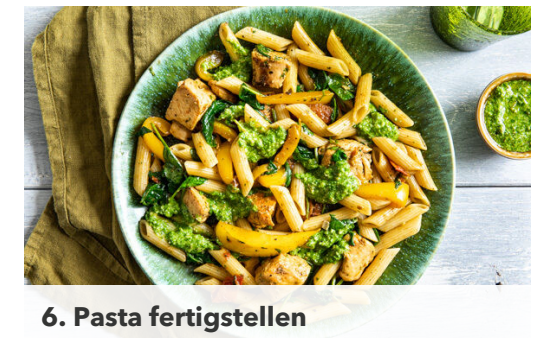
6. Pasta fertigstellen

Die Paprika und die Tomaten mit 1 kräftigen Prise Pfeffer in die Pfanne geben und 8-10Min. mitbraten, bis das Gemüse gar ist, dabei gelegentlich umrühren.