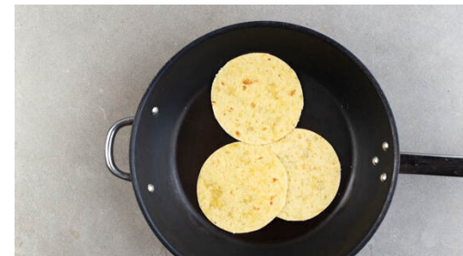
5. Tortillas aufwärmen

Eine große Pfanne ohne Öl mittelhoch bis stark erhitzen, dann das Fleisch mit 2EL Olivenöl in die Pfanne geben und bei starker Hitze auf jeder Seite 2-3Min. braten, abhängig davon, ob es medium oder eher durchgebraten sein soll. Aus der Pfanne nehmen und bis zum Servieren auf einem Teller abgedeckt ruhen lassen.