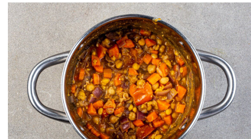
5. Masala fertigstellen

Das Fleisch 30-35Min. im Ofen backen. Nach ca. 25Min. überprüfen, ob das Fleisch zu bräunen beginnt. Mit Alufolie abdecken und zu Ende garen.