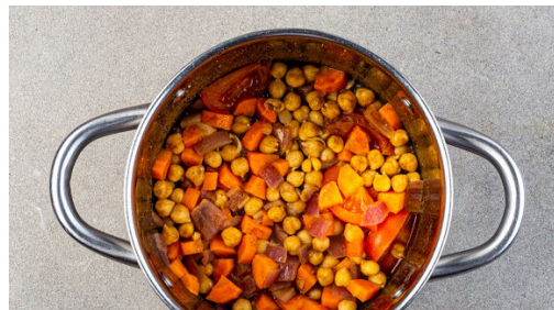
4. Masala köcheln

Den Backofen auf 220°C (200°C Umluft) vorheizen. Die Karotte ggf. schälen, dann vierteln und in 1-2cm große Würfel schneiden. Die Zwiebel schälen, halbieren und in ebenfalls 1-2cm große Würfel schneiden. Die Tomaten in Spalten schneiden. Die Kichererbsen in einem Sieb mit kaltem Wasser abspülen und abtropfen lassen.