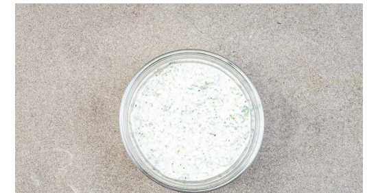
6. Minzjoghurt zubereiten

Einige Kichererbsen mit einem Kartoffelstampfer oder einer Gabel zerdrücken, um das Masala anzudicken. Weitere 4-5Min. kochen, bis das Masala die gewünschte Cremigkeit hat. Mit Salz abschmecken. Tip: Ggf. den Deckel zum Ende abnehmen, damit mehr Flüssigkeit verdampft oder mehr Wasser angießen, falls das Masala zu dickflüssig ist.