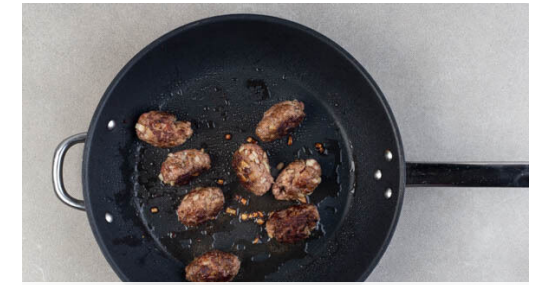
3. Köfte braten

Den Knoblauch schälen und sehr fein würfeln oder durch eine Knoblauchpresse drücken. Die Zwiebeln schälen, halbieren und fein würfeln. Das Hackfleisch mit dem Knoblauch , der ½ der Zwiebeln , der Gewürzmischung und je ½TL Salz und Pfeffer verkneten.