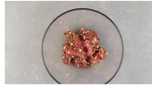
2. Hackfleisch würzen

Den Backofen auf 200°C (180°C Umluft) vorheizen. 50ml Essig und 50ml Wasser mit 1EL Zucker und 2TL Salz in einem kleinen Topf zum Kochen bringen, dabei gelegentlich umrühren. Den Topf vom Herd nehmen. Den Ingwer schälen und fein reiben. Den Ingwer und den Rotkohl mit dem Einlegesud vermengen.