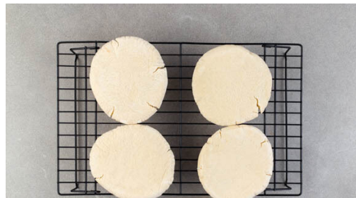
4. Brote erwärmen

Die Hackmasse in 16 gleich große Kugeln formen, dazu am besten die Hackmasse in 2 Portionen teilen und jede Portion wiederum teilen, bis die gewünschte Anzahl erreicht ist. Die Hackkugeln leicht flach und in eine ovale Form drücken, dann in einer großen Pfanne mit 2EL Olivenöl bei mittlerer bis starker Hitze auf jeder Seite 2-3Min. braten, bis das Fleisch gar und goldbraun ist.