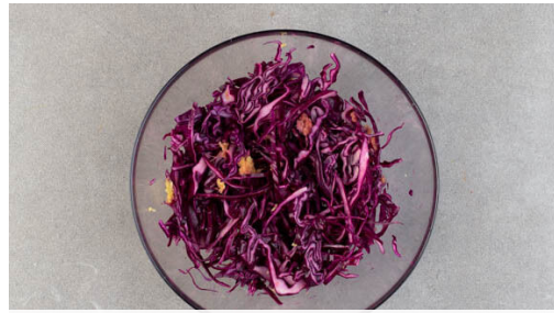
1. Salat vorbereiten

Energie 827kcal, Fett 31.9g, Kohlenhydrate 89.7g, Eiweiß 42.7g