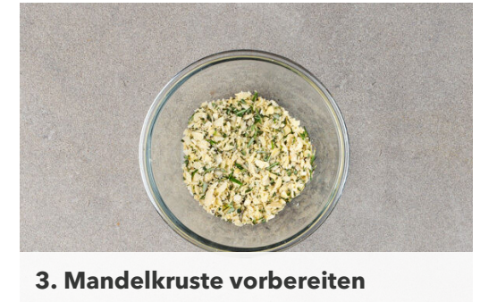
3. Mandelkruste vorbereiten

Die Kräuter-Mandel-Butter auf die Medallions streichen, etwas andrücken und die Medallions 6-8Min. übergrillen. Tipp: Wer keine ofenfeste Pfanne hat, kann die Medallions auch in eine Auflaufform geben.