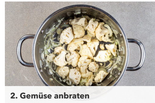
2. Gemüse anbraten

Die Baconscheiben auf eine Seite eines mit Backpapier ausgelegten Backblechs legen. Den restlichen Blumenkohl in ca. 1cm große Röschen schneiden und auf der anderen Seite des Blechs mit 1EL Pflanzenöl und 1 Prise Salz vermengen. Im Ofen 11-13Min. backen, bis der Bacon knusprig und der Blumenkohl appetitlich gebräunt ist.