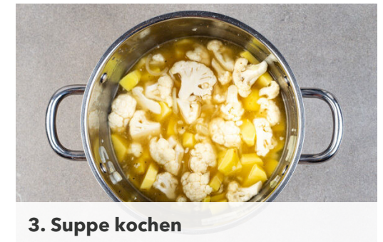
3. Suppe kochen

Den Schnittlauch in feine Röllchen schneiden. Die Chilischote in feine Ringe schneiden. Tipp: Für weniger Schärfe die Kerne entfernen.