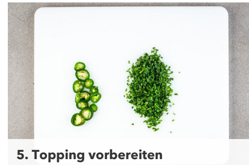
5. Topping vorbereiten

Die Zwiebeln und den Knoblauch in einem großen Topf mit 2EL Pflanzenöl bei mittlerer bis starker Hitze ca. 2Min. glasig anschwitzen. Die 1/2 des Blumenkohls mit je 1 kräftigen Prise Salz und Pfeffer hinzufügen und ca. 1Min. mitbraten.