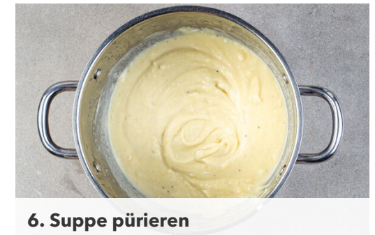
6. Suppe pürieren

Die Kartoffeln mit dem Brühwürz und 1L Wasser in den Topf geben, abdecken und zum Kochen bringen. Die Suppe bei mittlerer Hitze 15-17Min. kochen, bis die Kartoffeln gar sind.