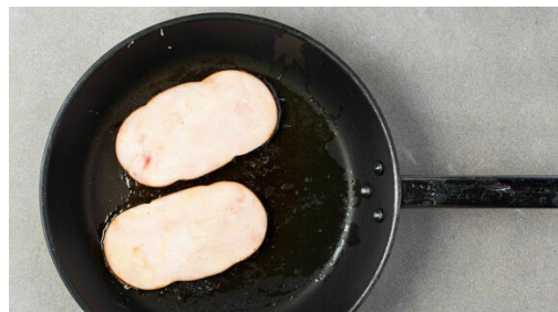
4. Kassler anbraten

Den Backofen auf 200°C (180°C Umluft) vorheizen. 4EL Mayonnaise, 2EL Ketchup, 2EL Senf und 2EL Essig zu einem Dip verrühren, mit Salz und Pfeffer abschmecken.