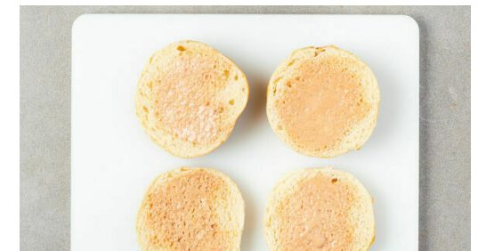
6. Belegen und servieren

Die Tomaten in dünne Spalten schneiden und mit dem Salat vermengen. Aus 3EL Olivenöl, 2EL Essig sowie je 1 kräftigen Prise Salz, Pfeffer und Zucker ein Dressing anrühren. Beides bis zum Servieren beiseitestellen.