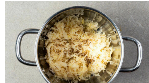
2. Sauerkraut erwärmen

Das Fleisch in einer großen Pfanne mit 2EL Olivenöl bei starker Hitze 2-3Min. braten, dann wenden und weitere 1-2Min. braten. Inzwischen die Brötchen auf dem Ofenrost ca. 8Min. knusprig aufbacken.