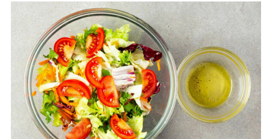
3. Salat vorbereiten

Den Käse auf dem Fleisch verteilen und das Fleisch abgedeckt ca. 1Min. weitergaren, bis der Käse geschmolzen ist.