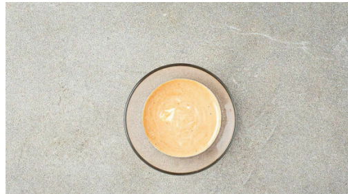
1. Dip anrühren

Energie 709kcal, Fett 46.3g, Kohlenhydrate 41.1g, Eiweiß 33.0g