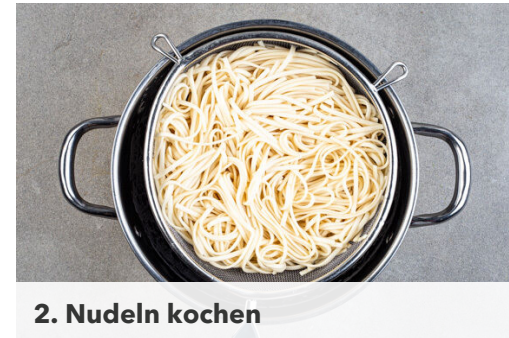
2. Nudeln kochen

In einem mittelgroßen Topf ausreichend gesalzenes Wasser für ¾ der Nudeln zum Kochen bringen. Die Pilze in einer mittelgroßen Pfanne oder einem Wok mit 1EL Pflanzenöl bei mittlerer bis starker Hitze 3-4Min. goldbraun anbraten. Den Knoblauch schälen und fein würfeln. Die Tomaten in ca. 1cm große Würfel schneiden. Die Pilze beiseitestellen, die Pfanne aufbewahren.