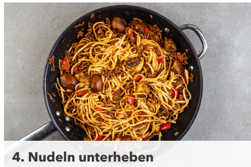
4. Nudeln unterheben

Inzwischen 1EL Pflanzenöl in der Pfanne bei mittlerer Hitze erwärmen. Das Hackfleisch zugeben und in 4-6Min. gar und leicht knusprig braten. Die Chilipaste , die Misopaste und die Tomatenwürfel einrühren und 30Sek.-1Min. erhitzen, dann den Knoblauch hinzugeben und ebenfalls ca. 30Sek. mitbraten.