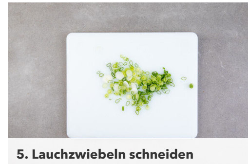
5. Lauchzwiebeln schneiden

Das Hackfleisch mit 1TL Salz und 1 kräftigen Prise Pfeffer würzen. Die Pilze zurück in die Pfanne geben, dann die Nudeln unterheben und nochmals mit Salz und Pfeffer abschmecken.