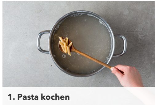
1. Pasta kochen

Energie 954kcal, Fett 37.5g, Kohlenhydrate 115.0g, Eiweiß 37.4g