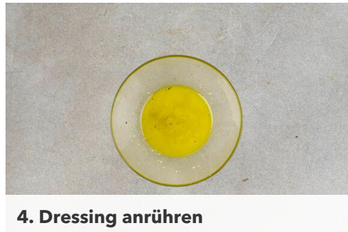
4. Dressing anrühren

Den Lauch längs halbieren und quer in feine Streifen schneiden. Die Limettenschale abreiben, dann die Limette halbieren und auspressen. Ca. 1TL Ingwer schälen und fein reiben. Tipp: Wer mag, kann auch mehr Ingwer verwenden.