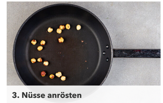
3. Nüsse anrösten

Die ½ der Roten Bete in ein Sieb abgießen, abtropfen lassen und in grobe Würfel schneiden. Tipp: Da Rote Bete stark färbt, beim Verarbeiten am besten Küchenhandschuhe und Schürze tragen. 2EL Essig, ½TL Zucker und ½TL Salz verrühren und mit der Roten Bete vermengen. Den Apfel in grobe Stücke schneiden, dabei die Kerne entfernen.