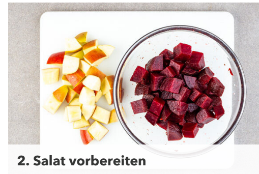
2. Salat vorbereiten

Den Sellerie vierteln, mit einem Messer schälen und in 2-3cm große Stücke schneiden. In einem mittelgroßen Topf mit 1EL Olivenöl bei mittlerer Hitze abgedeckt ca. 5Min. dünsten. Mit 100ml Wasser ablöschen und mit 1 kräftigen Prise Salz und 1 Prise Pfeffer würzen. Bei niedriger Hitze ca. 10Min. abgedeckt weich kochen. Abgießen und zurück in den Topf geben, dabei das Kochwasser auffangen.