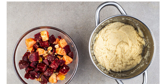
6. Püree zubereiten

Die Pfanne vom Herd nehmen und das Fleisch mit der Balsamicocreme beträufeln, dabei wenden, um es gleichmäßig zu glasieren. Mit 1 kräftigen Prise Salz und 1 Prise Pfeffer würzen und bis zum Servieren auf einem Teller abgedeckt ruhen lassen.