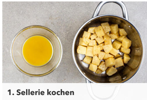
1. Sellerie kochen

Energie 548kcal, Fett 26.6g, Kohlenhydrate 36.5g, Eiweiß 36.0g