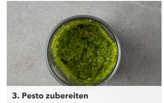
3. Pesto zubereiten

Die Zucchini längs halbieren und quer in dünne Scheiben schneiden. Die Paprika vierteln, entkernen und in dünne Streifen schneiden. Die Tomate vierteln, dabei die Kerne entfernen und das Fruchtfleisch in dünne Streifen schneiden.