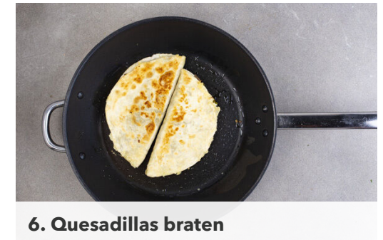
6. Quesadillas braten

Den Lauch in einer großen Pfanne mit 1EL Olivenöl und 1 Prise Salz bei mittlerer bis starker Hitze 3-4Min. weich braten. Dann das Hackfleisch dazugeben und 5-6 Min. krümelig anbraten, kräftig mit Salz und Pfeffer abschmecken.