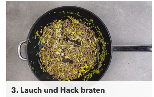
3. Lauch und Hack braten

Die Karotte ggf. schälen und rundum mit einem Sparschäler in dünne Streifen schneiden. Die Zucchini ebenfalls mit dem Sparschäler in dünne Streifen schneiden. Die Gemüwestreifen mit dem Dressing vermengen.