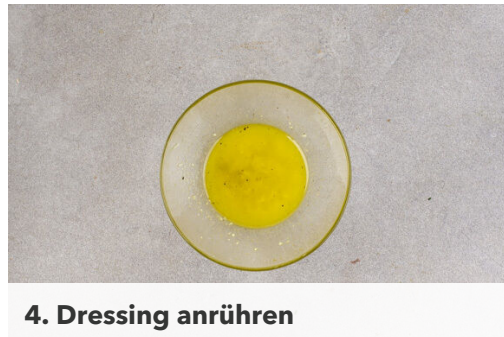
4. Dressing anrühren

Den Lauch längs halbieren und quer in feine Streifen schneiden. Die Limettenschale abreiben, dann die Limette halbieren und auspressen. Ca. 1TL Ingwer schälen und fein reiben. Tipp: Wer mag, kann auch mehr Ingwer verwenden.