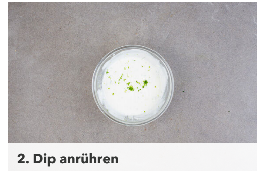
2. Dip anrühren

1EL Limettensaft mit der ½ des Ingwers , 2EL Olivenöl , 1TL Zucker und je 1 Prise Salz und Pfeffer zu einem Dressing verrühren. Nach Wunsch mit mehr Ingwer abschmecken.