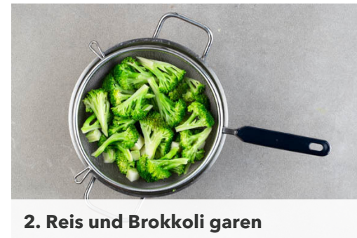
2. Reis und Brokkoli garen

In einem mittelgroßen Topf mit Dämpfeinsatz oder passendem Sieb 300ml leicht gesalzenes Wasser zum Kochen bringen. Den Reis in einem Sieb kalt abspülen, bis das Wasser klar bleibt. Den Brokkoli in mundgerechte Röschen schneiden, den Strunk ggf. schälen und in 1-2cm große Würfel schneiden.