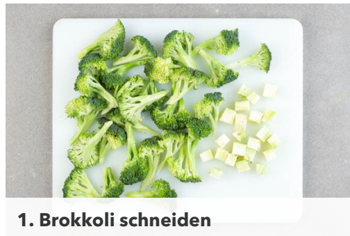
1. Brokkoli schneiden

Energie 695kcal, Fett 24.3g, Kohlenhydrate 90.2g, Eiweiß 24.4g