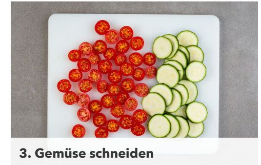
3. Gemüse schneiden

Den Schnittlauch , den Knoblauch , die Zucchiniwürfel , die Kürbiskerne , 2EL Olivenöl und 1EL Wasser in einem hohen Gefäß mit einem Stabmixer zu einem cremigen Pesto pürieren. Mit Salz und Pfeffer abschmecken.