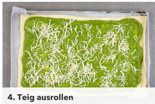
4. Teig ausrollen

Die übrige Zucchini in dünne Scheiben schneiden. Die Kirschtomaten halbieren.