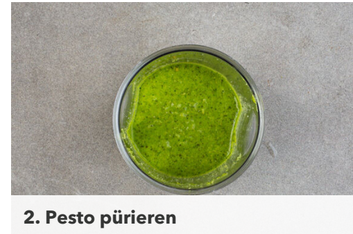
2. Pesto pürieren

Den Backofen auf 240°C (220°C Umluft) vorheizen. Den Schnittlauch grob schneiden. Den Knoblauch schälen und grob würfeln. Ca. 1/3 der Zucchini in kleine Würfel schneiden.